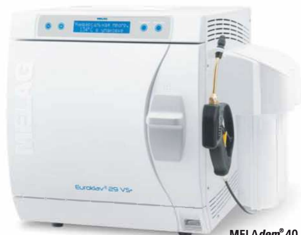
MELAdem® 40 установленный на автоклаве Euroklav® 29 VS+

Обслуживание автоклавов должно быть приятным и безопасным. Дизайн полностью соответствует этим требованиям. Он не только внешне привлекателен, но и рационален. Например, большой дверной запор не просто элемент дизайна, но и обеспечивает лёгкое и безопасное открывание и закрывание двери.