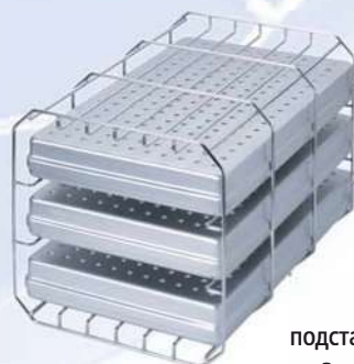
подставка типа А (повёрнутая на 90град.) на 3 стандартные кассеты