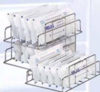
подставка для упакованных инструментов