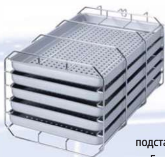
подставка типа А на 5 лотков

Автоклавы всегда поставляются с подставкой для лотков или кассет, включённой в стоимость. Обычно это подставка типа «А» (для 5 лотков или 3 стандартных кассет). Подставка для упакованных инструментов делает возможным вертикальную стерилизацию упакованных предметов для оптимальных результатов сушки.