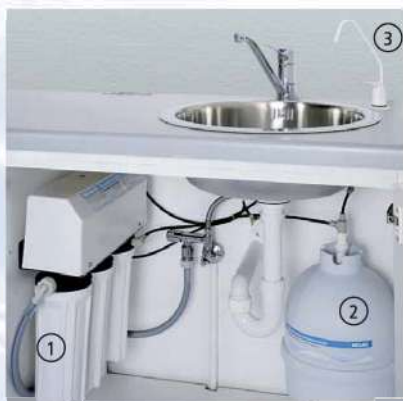
MELAdem®47 (1) в шкафчике в комплекте с накопительным баком (2) и краном (3)